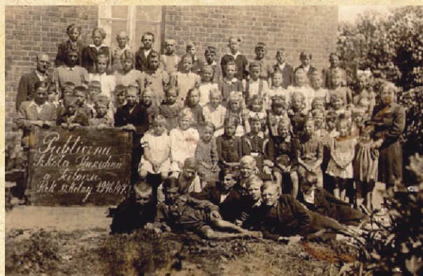
Najstarsze zdjęcia szkolne z 1947 r.

Komitet Budowy Szkoły, którego zadaniem była budowa nowego obiektu szkolnego. Przy czynnym udziale mieszkańców Ściborza, prace budowlane trwały do sierpnia 1966 r. Uroczyste otwarcie nastąpiło 15 września 1966 r.